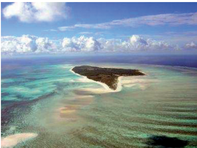
Île Juan de Nova

Le Canal du Mozambique est cet idyllique détroit de l'Océan Indien qui sépare Madagascar de la côte africaine, plus particulièrement du Mozambique. Les pays côtiers du détroit incluent aussi les Comores et la France, grâce à l'île Mayotte et aux îles Éparses, nom sous lequel sont regroupés 5 minuscules îlots : Europa, Juan de Nova, Bassa de Nova et les Glorieuses, Tromelin. Mayotte et les îles Éparses font l'objet depuis plusieurs décennies d'un contentieux avec les Comores, Madagascar et Maurice.